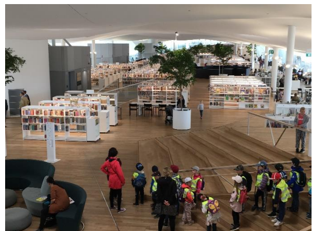
Figur 3 Oodi.