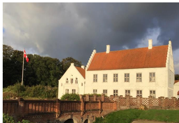
Figur 4 Nr. Vosborg.

På opfordring af bestyrelsen har et par af medlemmerne oprettet en lukket Facebookgruppe for seniorgruppens medlemmer. Gruppen er et supplement til nyhedsbreve, og kan bruges til forslag til arrangementer, aftaler om samkøring, deling af fotos fra arrangementer og møder. Gruppen er kommet flyvende fra start, der er allerede nu over 120 medlemmer, og der ligger en del billeder fra turene til Helsinki, Christiansfeld, Nr. Vosborg, Vejle og Tingbjerg.