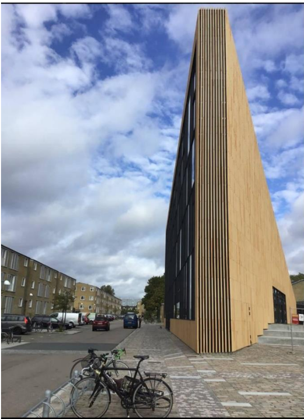
Figur 1 Tingbjerg Bibliotek.

I september besøgte vi det nye Tingbjerg Bibliotek og Honningkagebyen Christiansfeld.